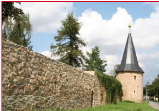
Stadtmauer mit Türmchen